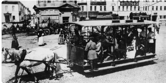
Q5: Moskau Pferdebahn

Mit der Straßenbahn durch Leipzig zu fahren, ist heute ganz normal. Doch das war nicht immer so. Am 18. Mai 1872 begann mit der Eröffnung des Linienbetriebs der Leipziger Pferde-Eisenbahn die Geschichte der Straßenbahn in Leipzig. Die Abbildung Q5 zeigt dir, wie die Pferdestraßenbahn ausgesehen hat.