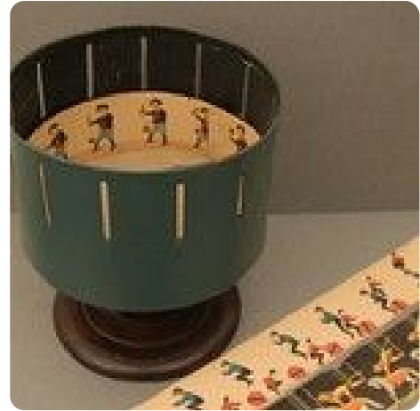
Zoetrop und Papierstreifen

Das Zoetrop ist ein einfaches optisches Gerät, ein Vorläufer des Kinos. Auf mechanischem Weg werden bewegte Bilder erzeugt. Die Geschwindigkeit der Drehbewegung lässt die vielen Öffnungen wie eine einzige, durch die hindurch man die sich bewegenden Figuren sehen kann, erscheinen.