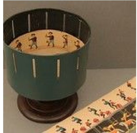
Zoetrop und Papierstreifen

Das Zoetrop ist ein einfaches optisches Gerät, ein Vorläufer des Kinos. Auf mechanischem Weg werden bewegte Bilder erzeugt. Die Geschwindigkeit der Drehbewegung lässt die vielen Öffnungen wie eine einzige, durch die hindurch man die sich bewegenden Figuren sehen kann, erscheinen.