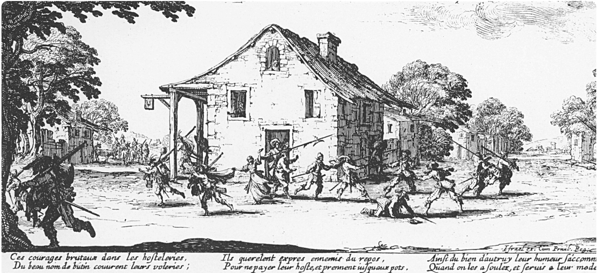
Q2: Die Plünderung, Kupferstich von 1633, wikipedia.com, gemeinfrei