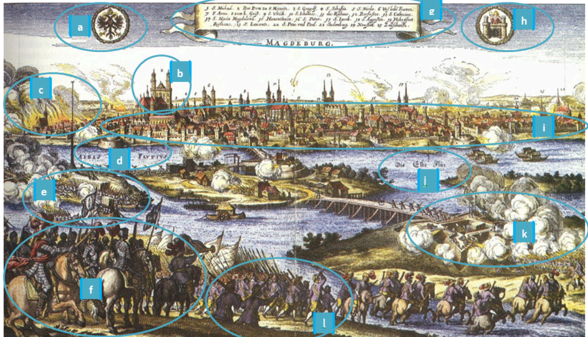
Q1 Zeichnung: Sturm auf Magdeburg, 1631, wikipedia.com, gemeinfrei

④ Beschrifte die auf dem Bild erkennbaren Elemente der Stadt, der Truppen und der Umgebung in dem die die folgenden Begriffe zuordnet: