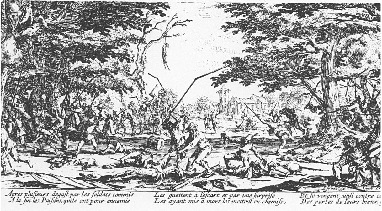
Q5: Die Rache der Bauern, Kupferstich von 1633

① Beschreibt die euch vorliegende Bildquelle Q5 hinsichtlich: