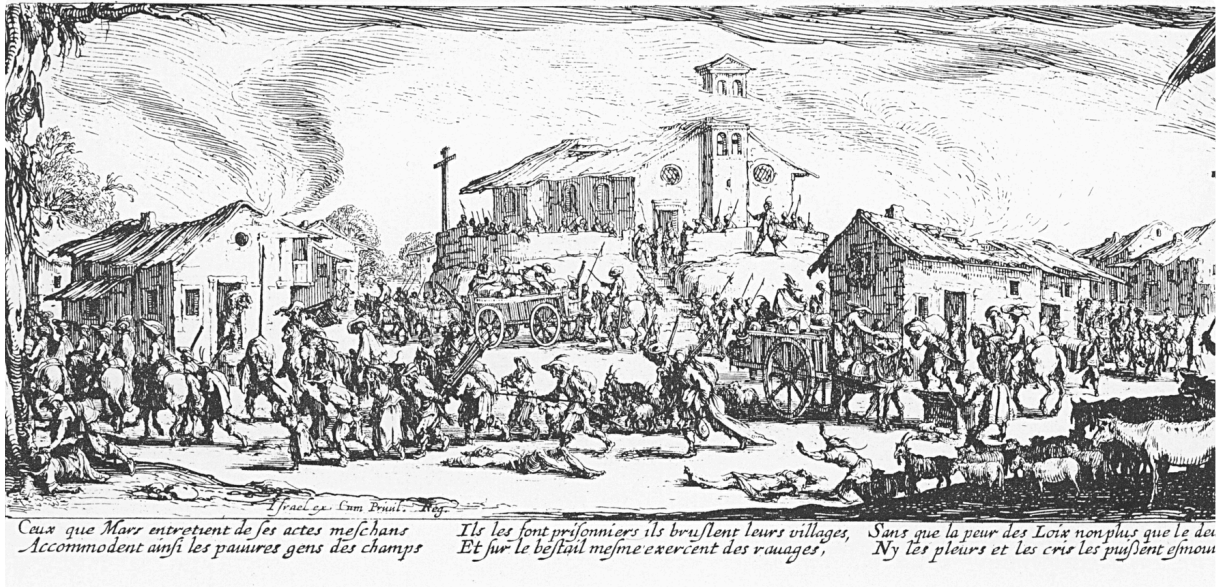
Q4: Zerstörung und Verbrennung eines Dorfes, Kupferstich von 1633

① Beschreibt die euch vorliegende Bildquelle Q4 hinsichtlich: