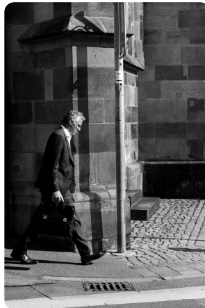
une personne à pied