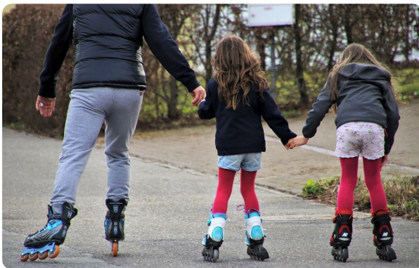
les personnes aux patins à roulettes