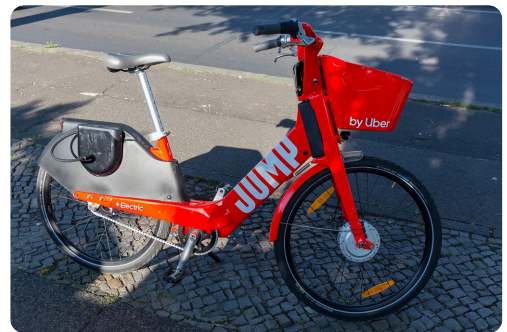
un vélo (électronique)