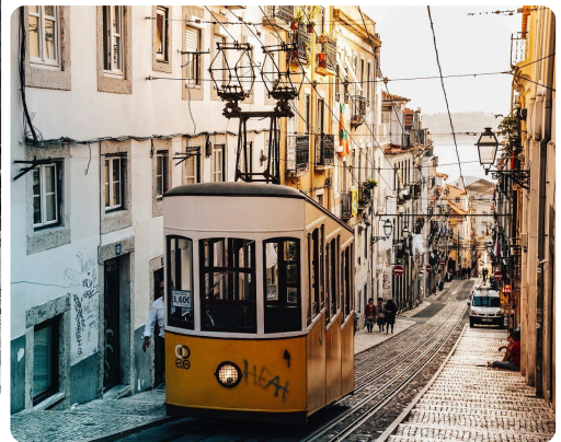
le tram (le transport publique)