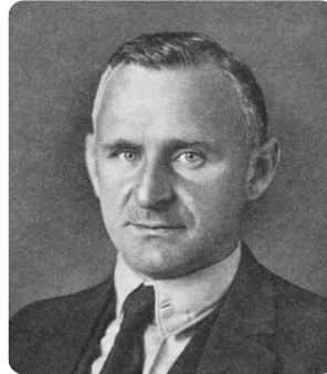
Q1: Carl Friedrich Goerdeler