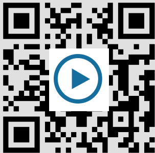
M8: Erklärvideo Flinga https://t1p.de/688s

Schau dir das Erklärvideo M9 an und erfahre mehr über die Funktionen von Flinga.