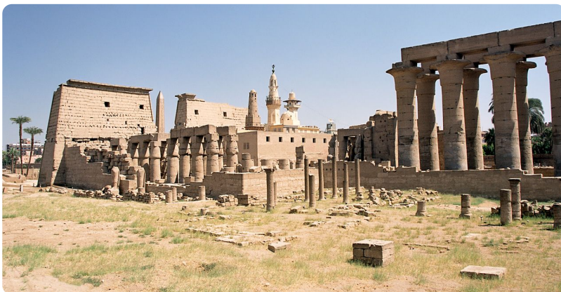
Tempel von Luxor