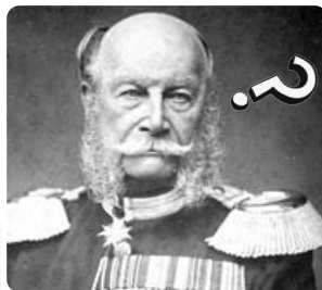
Q1: Wilhelm I. https://t1p.de/3fl8