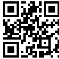
M1 Video: Der Weg zum Kaiserreich https://t1p.de/252a