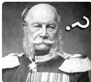
Q1: Wilhelm I. https://t1p.de/3fl8