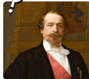
Q4: Napoleon III. https://t1p.de/1vxx