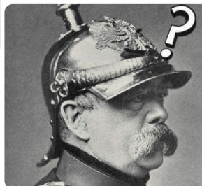
Q3: Otto von Bismarck https://t1p.de/tn63