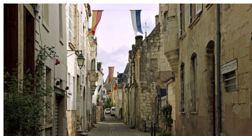
coger la primera segunda tercera calle