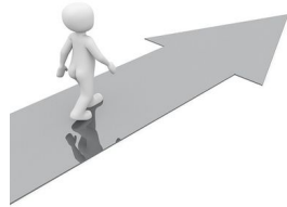
ir todo recto