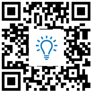
M6: Erklärvideo virtueller Rundgang https://t1p.de/videoversailles