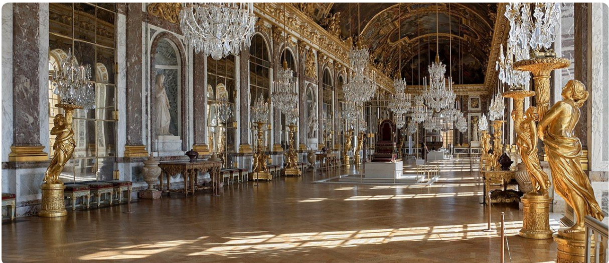
M7 Der Spiegelsaal von Versailles 2011