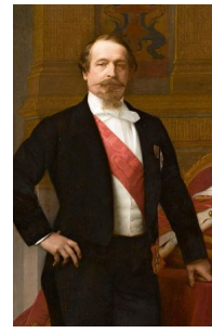
Napoleon III. https://t1p.de/1vwx

Die SuS nutzen die Anwendung M4 zur Erstellung eines individuellen Schaubildes. Inhalt dieses Schaubildes ist ein Beziehungsgefüge zwischen dem Deutschen Reich und Frankreichs vor 1870.