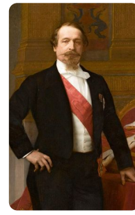
Napoleon III. https://t1p.de/1vwx

Die SuS nutzen die Anwendung M4 zur Erstellung eines individuellen Schaubildes. Inhalt dieses Schaubildes ist ein Beziehungsgefüge zwischen dem Deutschen Reich und Frankreich vor 1870.