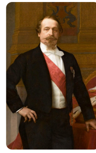
Napoleon III. https://t1p.de/1vxv

Die Schüler*innen nutzen die Anwendung M4 zur Erstellung eines individuellen Schaubildes. Inhalt dieses Schaubildes ist ein Beziehungsgefüge zwischen dem Deutschen Reich und Frankreich vor 1870.