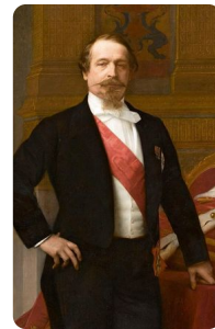
Napoleon III. https://t1p.de/1vwx