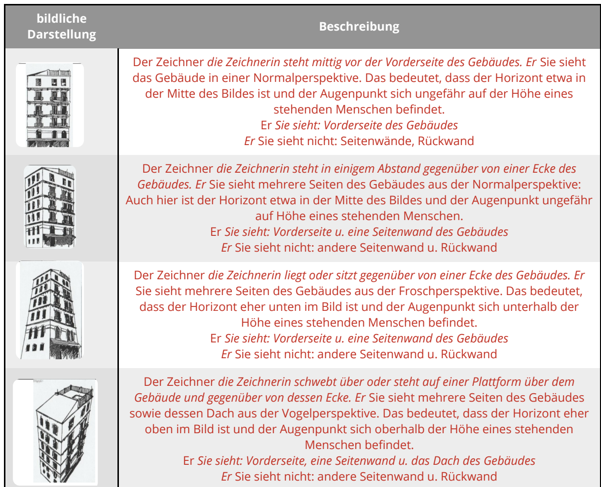
T1 Tabelle: Perspektive bildlicher Darstellungen

Quelle: Frieder Stange: Gebäudeskizzen, eigene Darstellung der „Gebäudeskizzen“ in B. Robertson: Intensivkurs Zeichnen, Augsburg 1900. | Public Domain.