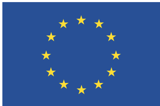
Flagge der EU