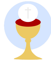
Blut und Leib Jesu