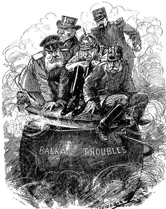
THE BOILING POINT.