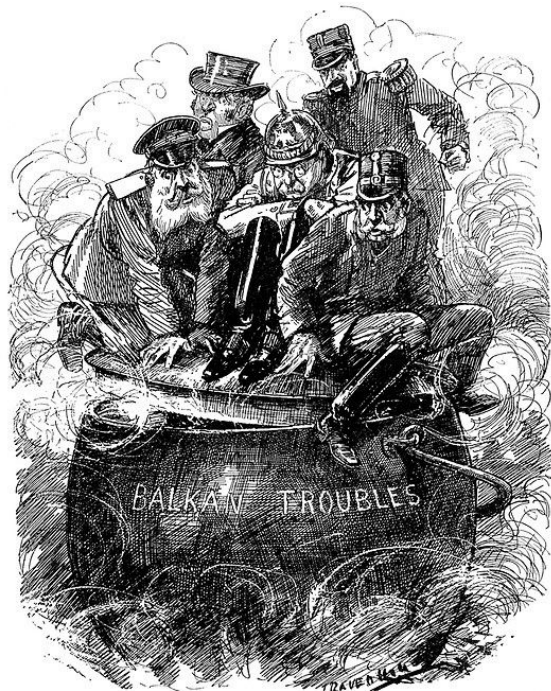
THE BOILING POINT.

Q1: Edwardian Era, Europe WW1 Cartoons Raven Hill Punch Magazine, 1912