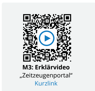
M3: Erklärvideo „Zeitzeugenportal“ Kurzlink