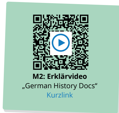
M2: Erklärvideo „German History Docs“ Kurzlink