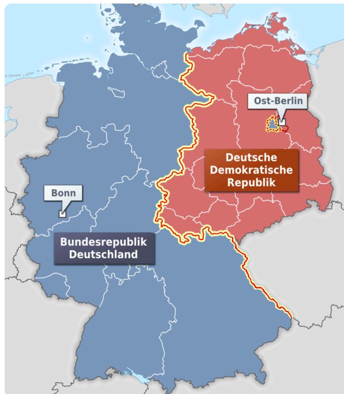
M1: Grenzverlauf BRD und DDR (1949-1990)