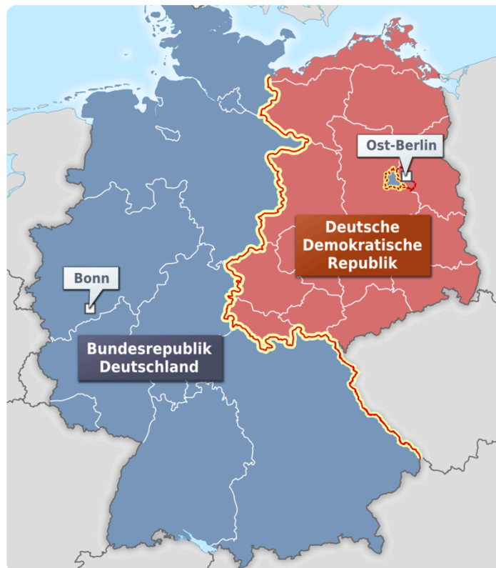
M1: Grenzverlauf BRD und DDR (1949-1990)