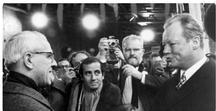
Q2: Annäherung der Regierungschefs, Willi Stoph (links) und Willy Brandt (rechts) in Erfurt 1970