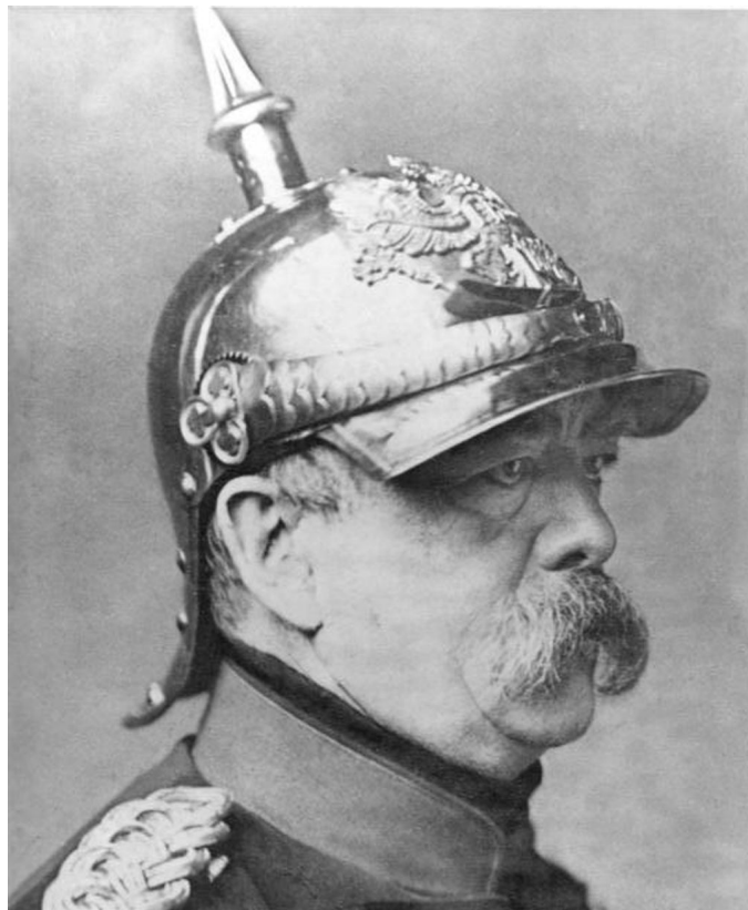
M1: Otto von Bismarck 1871