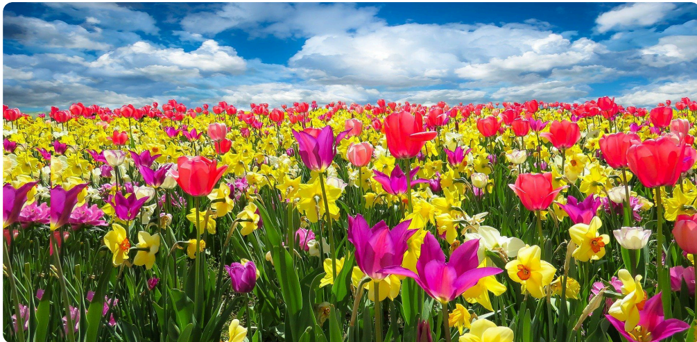
Im Frühling erwacht die Natur und die Blumen blühen.

Es heißt „im Winter schläft die Natur und im Frühling erwacht sie.“ Der Frühling beginnt offiziell am 21. März und dauert bis zum 21. Juni. Die Tage werden länger von etwa 3 Stunden im März bis über 7 Stunden im Juni. Dadurch nimmt auch die Temperatur im Frühling zu. Anfangs ist es noch spät-winterlich kühl mit Durchschnitts-Temperaturen um 7°C, später, im Juni ist die durchschnittliche Temperatur dann schon auf 20°C gestiegen. Niederschlag fällt nun fast ausschließlich in Form von Regen und nimmt am Anfang nur langsam zu, steigt im Juni dann deutlich an. Die Böden sind nicht mehr gefroren und viel weicher als im Winter. Auch der Frost von den Seen und Flüssen verschwindet wieder. Sonne, Wasser und Temperatur sind nun wieder ausreichend vorhanden, sodass die Pflanzen zu wachsen beginnen. Grüne Wiesen und Wälder sind überall zu sehen, die Bäume bekommen langsam wieder Blätter und die ersten Pflanzen zeigen ihre Blüten. Auch die ersten Ernten können gemacht werden: Einige Getreide-, Gemüse- und Obstsorten versorgen die Menschen bereits im Frühling. Der Frühling lässt viele Menschen glücklich werden und endet mit dem Beginn des Sommers - dem Höhepunkt des Jahres.