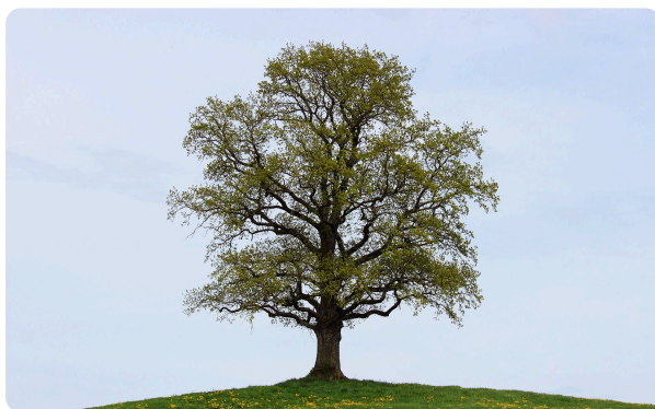
Die Blätter an den Bäumen kehren zurück.