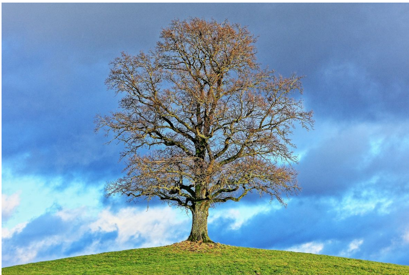
Ein Baum im Herbst. Die Blätter verlieren ihre grüne Farbe.