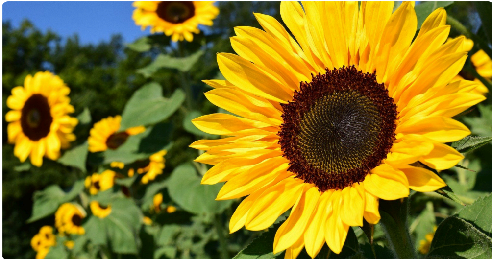
Der Sommer. Alles ist grün und die Sonnenblumen blühen.

Der Sommer ist die zweite große Jahreszeit in Deutschland und einfach gesagt ist er das Gegenteil vom Winter. Er dauert vom 21. Juni bis zum 22. September. Somit zählen die Monate Juni, Juli, August und September zum Sommer.