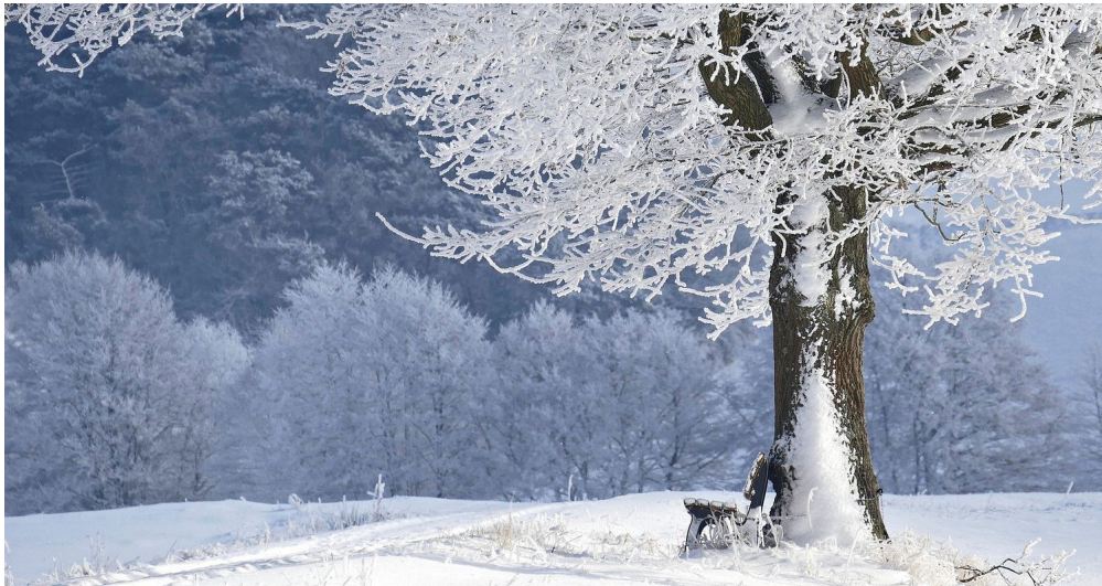
Der Winter bedeckt die Natur mit weißem Schnee.

Der Winter ist die kälteste Jahreszeit in Deutschland.