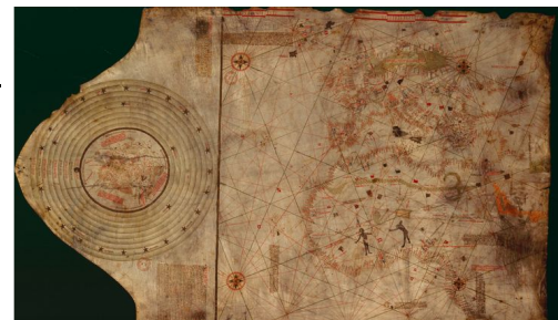
Q1 Kolumbuskarte, 1490

Historische Karten sind Quellen, da sie aus der Vergangenheit stammen. Historische Karten geben Auskunft über die geografischen Kenntnisse und die Vorstellungen der Gestalt der Erde, welche Menschen in der vergangenen Zeit hatten.