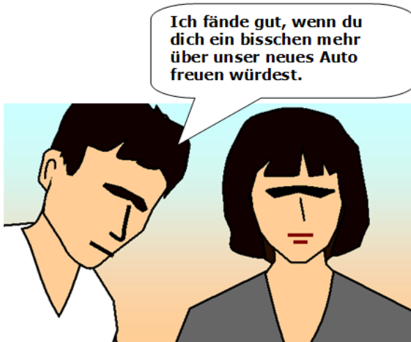
Abb.1 CC BY-SA