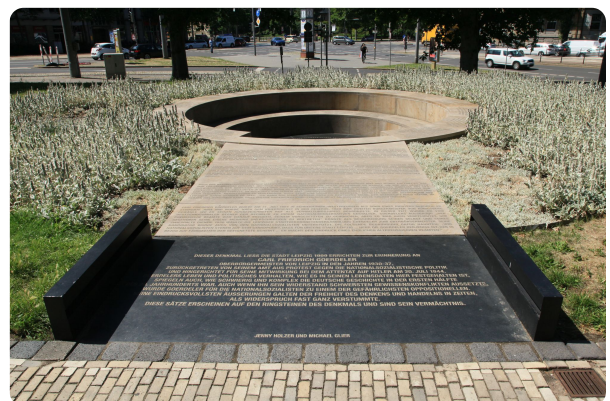
Q2: Goerdeler-Denkmal, Martin-Luther-Ring in Leipzig, 7. Juli 2015