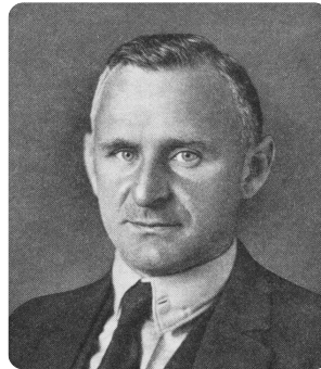
Q1: Carl Friedrich Goerdeler