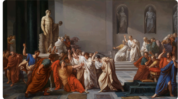
Die Ermordung des Julius Caesar

④ Übersetze die ersten 10 Zeilen des Lektionstextes (bis „ Hic sum. Venio “) in richtiges Deutsch!