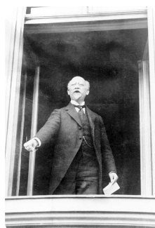
Bild: Philipp Scheidemann in der Reichskanzlei

9. November 1918: Ausrufung der Republik in Berlin