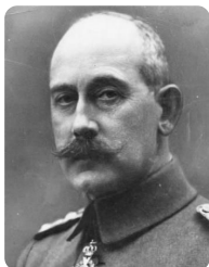
Bild: Prinz Max von Baden

3. Oktober 1918: Prinz Max von Baden wird Reichskanzler