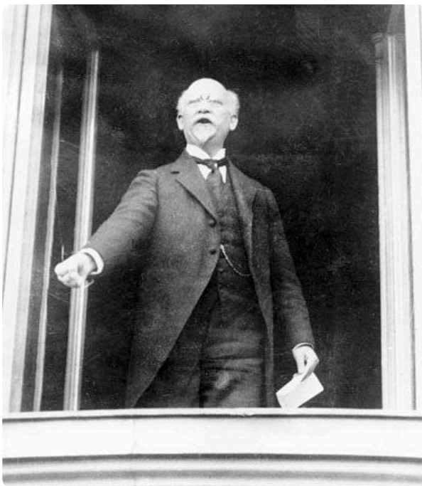
Bild: Philipp Scheidemann in der Reichskanzlei in Berlin