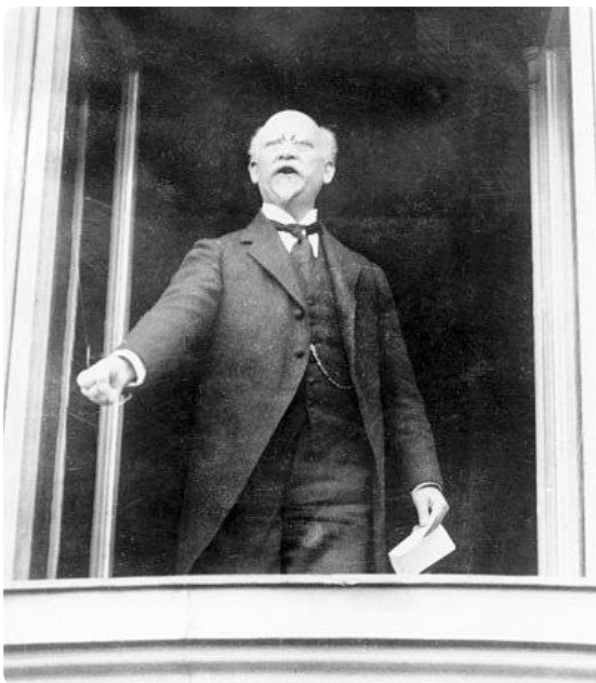
Bild: Philipp Scheidemann in der Reichskanzlei in Berlin