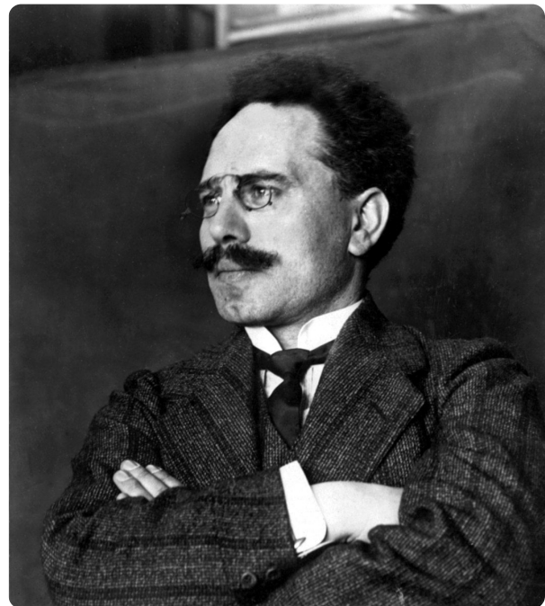
Bild: Portrait Karl Liebknecht