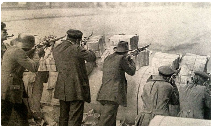
Bild: Barrikade während des Spartakusaufstandes , Wikimedia, Verlag J. J. Weber in Leipzig, Public domain, https://t1p.de/fh7w

Lade deinen Beitrag anschließend auf das Padlet M3 hoch.