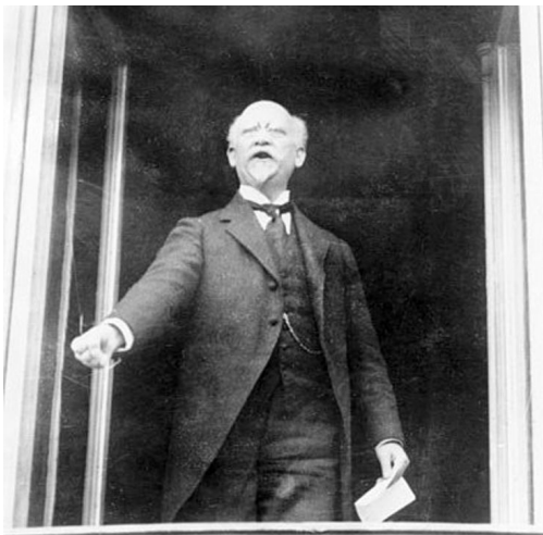
Bild: Philipp Scheidemann in der Reichskanzlei in Berlin