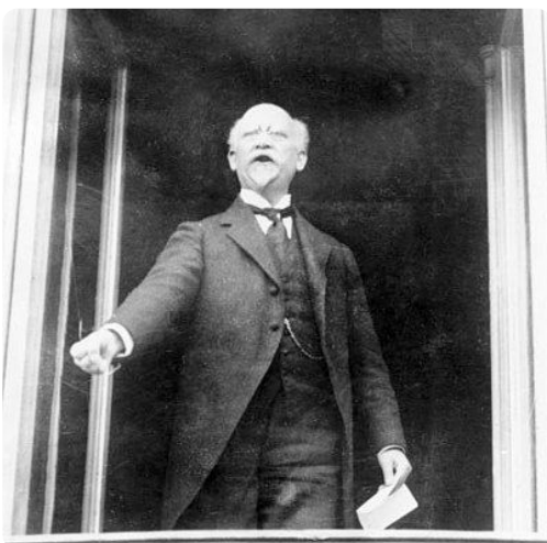
Bild: Philipp Scheidemann in der Reichskanzlei in Berlin