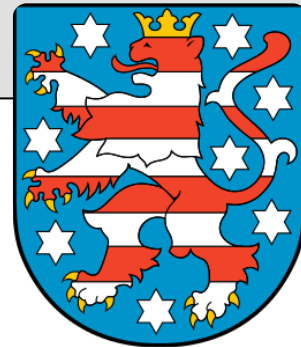
Bild: Wappen des Freistaates Thüringen , Wikimedia, Wappen (EPS) auf Landespräsenz (thuringen.de)/Public Domain, https://t1p.de/amdx

Im Jahr 1920 vereinigten sich sieben Kleinstaaten in Mitteldeutschland zu einem Land. Das Fundament für die Landesgründung legte die Novemberrevolution 1918 : Die Abdankung der Fürsten, ebnete den Weg dafür, dass sich die Kleinstaaten auf demokratischem Wege und auf freiwilliger Basis zusammenschließen konnten.