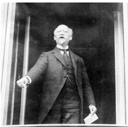
Bild: Philipp Scheidemann in der Reichskanzlei in Berlin