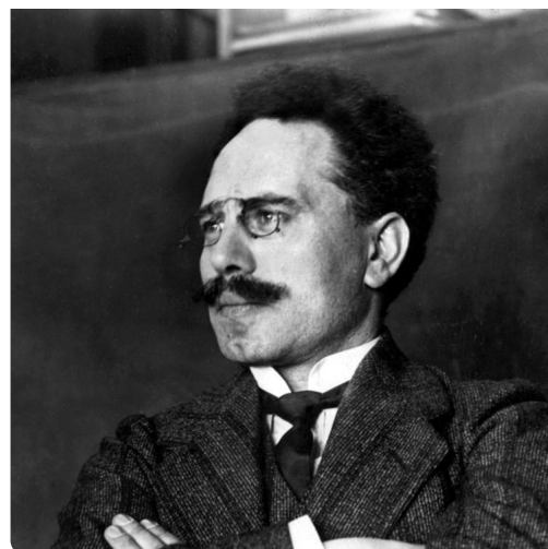
Bild: Portrait Karl Liebknecht