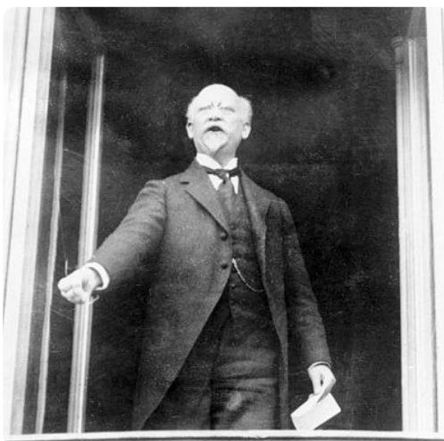
Bild: Philipp Scheidemann in der Reichskanzlei in Berlin