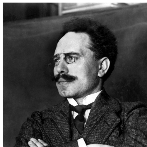
Bild: Portrait Karl Liebknecht