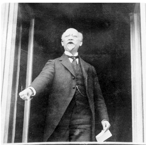
Bild: Philipp Scheidemann in der Reichskanzlei in Berlin