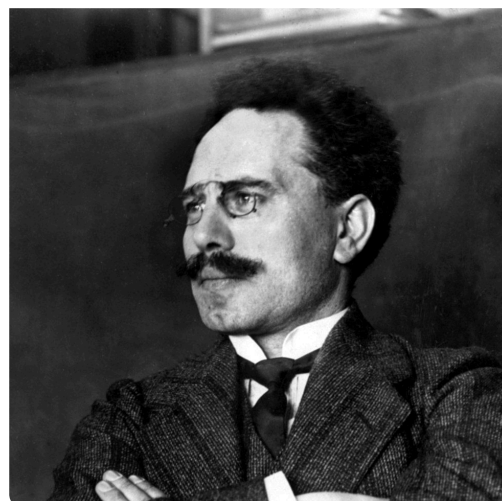
Bild: Portrait Karl Liebknecht