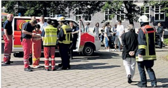
Nach der Evakuierung: Ärzte versorgen Verletzte, Schüler warten auf den Hil.

Explosion mit Salpetersäure am Felix-Klein-Gymnasium / 1100 Schüler evakuiert