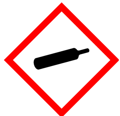
Gas unter Druck