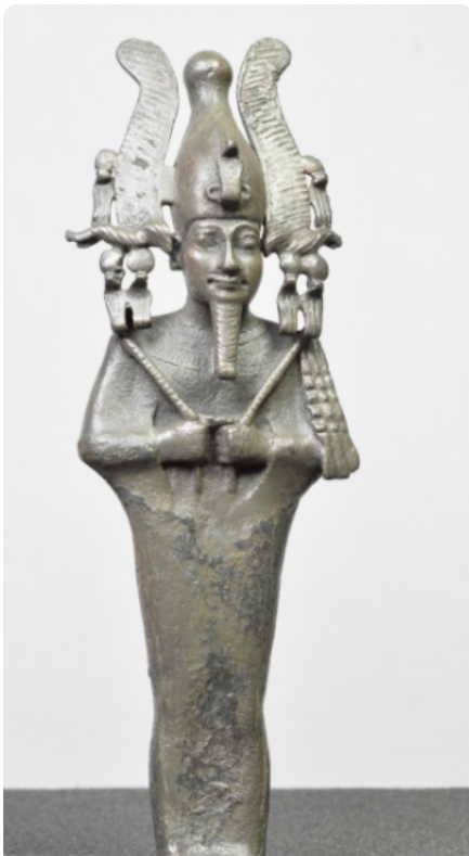
M5: Statuette Osiris, stehend mit Atef-Krone