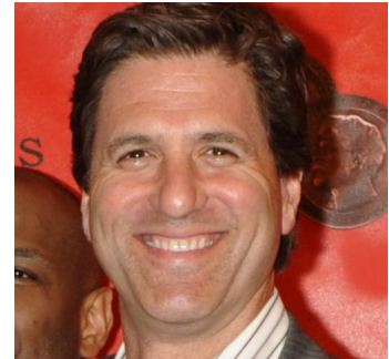
Steven Levitan - Drehbuchautor und Fernsehregisseur von Modern Family

Da ein Serienkonstrukt (Handlung, Erzählung und Zeit) sehr kompliziert sein kann, ist es sinnvoll, sich genauer damit zu beschäftigen.