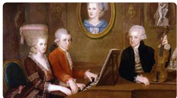
Wolfgang und Nannerl am Klavier. Daneben der Vater Leopold. Das Portrait an der Wand zeigt die verstorbene Mutter.

wieder ein Menuett, bevor der schnelle und feurige 4. Satz die Sinfonie abschließt. (Allegro con spirito.