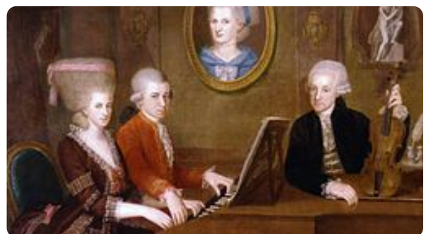
Wolfgang und Nannerl am Klavier. Daneben der Vater Leopold. Das Portrait an der Wand zeigt die verstorbene Mutter.

In dieser Sinfonie spielt ein recht kleines Orchester: Es spielen 2 Hörner, 2 Oboen und Streichinstrumente. Flöten und Fagotte sind nicht dabei. Die vier Sätze der Sinfonie unterscheiden sich in ihrem Charakter und in ihrem Tempo. Der erste Satz ist recht schnell und im 2/2-Takt „Allegro moderato“. Der zweite Satz ist eher langsam und überschrieben mit „Andante“ (das bedeutet „gehend“). Im dritten Satz wählt er wieder ein Menuett, bevor der schnelle und feurige 4. Satz die Sinfonie abschließt. (Allegro con spirito.