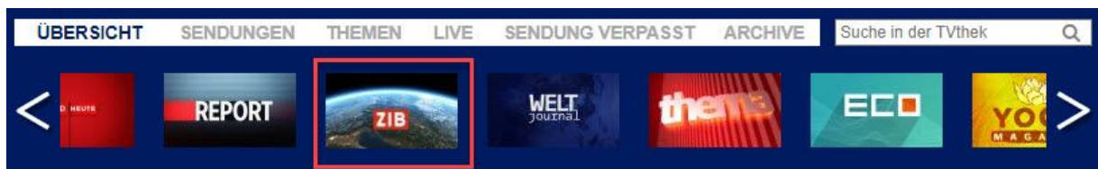
Screenshot der ORF TVthek