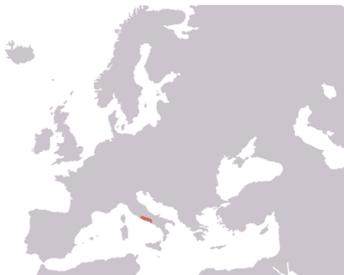
M14: Römisches Reich 320 v. Chr. Republik