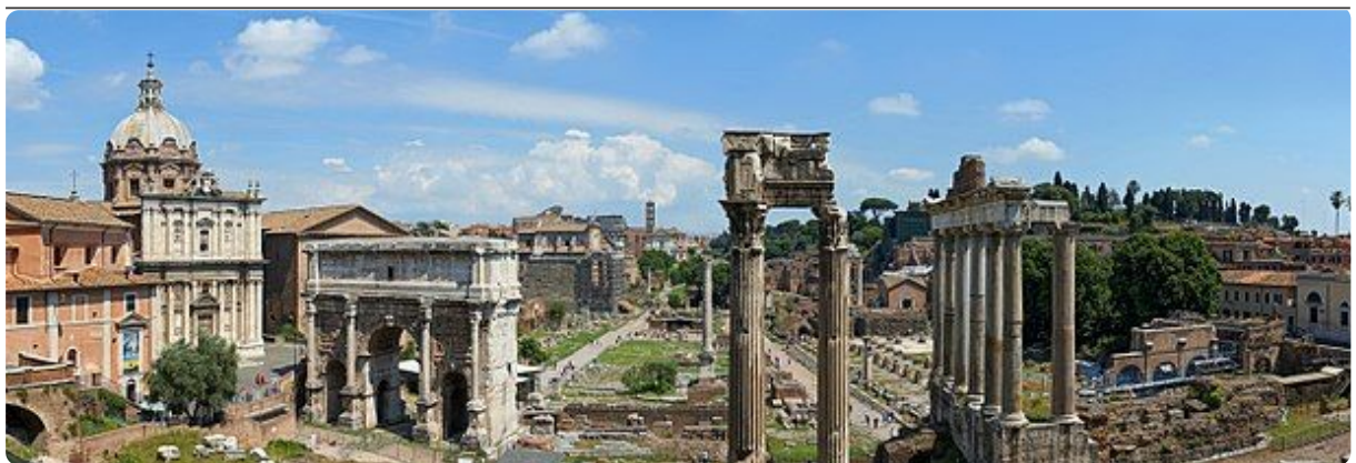
M22: Forum Romanum, 2012, CC BY-SA 3.0, https://t1p.de/7wlv