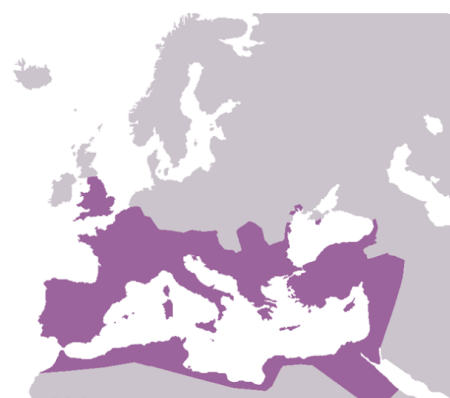
M15: Römisches Reich 230 n. Chr. Kaiserzeit