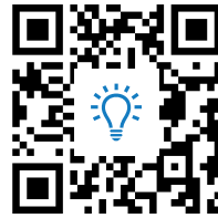
M2: Zuordnungsaufgabe Außenpolitik