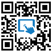
M6: Digitale Tafel https://t1p.de/jhu1

③ Ladet die digitale Karte zur Außenpolitik Hitlers auf die digitale Tafel M6 .