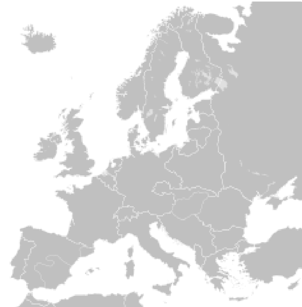
M3: Europa Oktober 1938 - März 1939