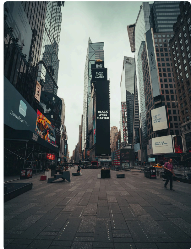
Abb. 1 — 05.06.2020, Time Square, NYC